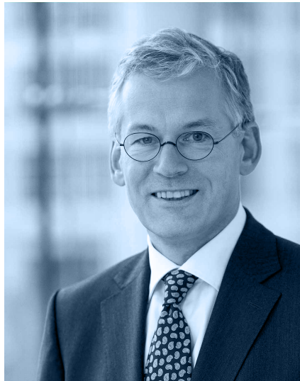
Philips-CEO Frans van Houten

De splitsing is het sluitstuk van een vier decennia durende inkrimping van het Eindhovense concern, mede veroorzaakt door een verkoop van bedrijfsonderdelen. Het concern Philips telde in 1972 412.000 arbeidskrachten,