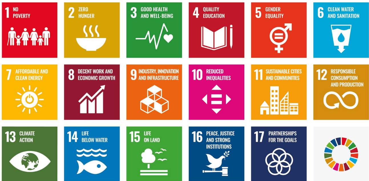
FIGUUR 1: DE 17 SUSTAINABLE DEVELOPMENT GOALS VAN DE VN